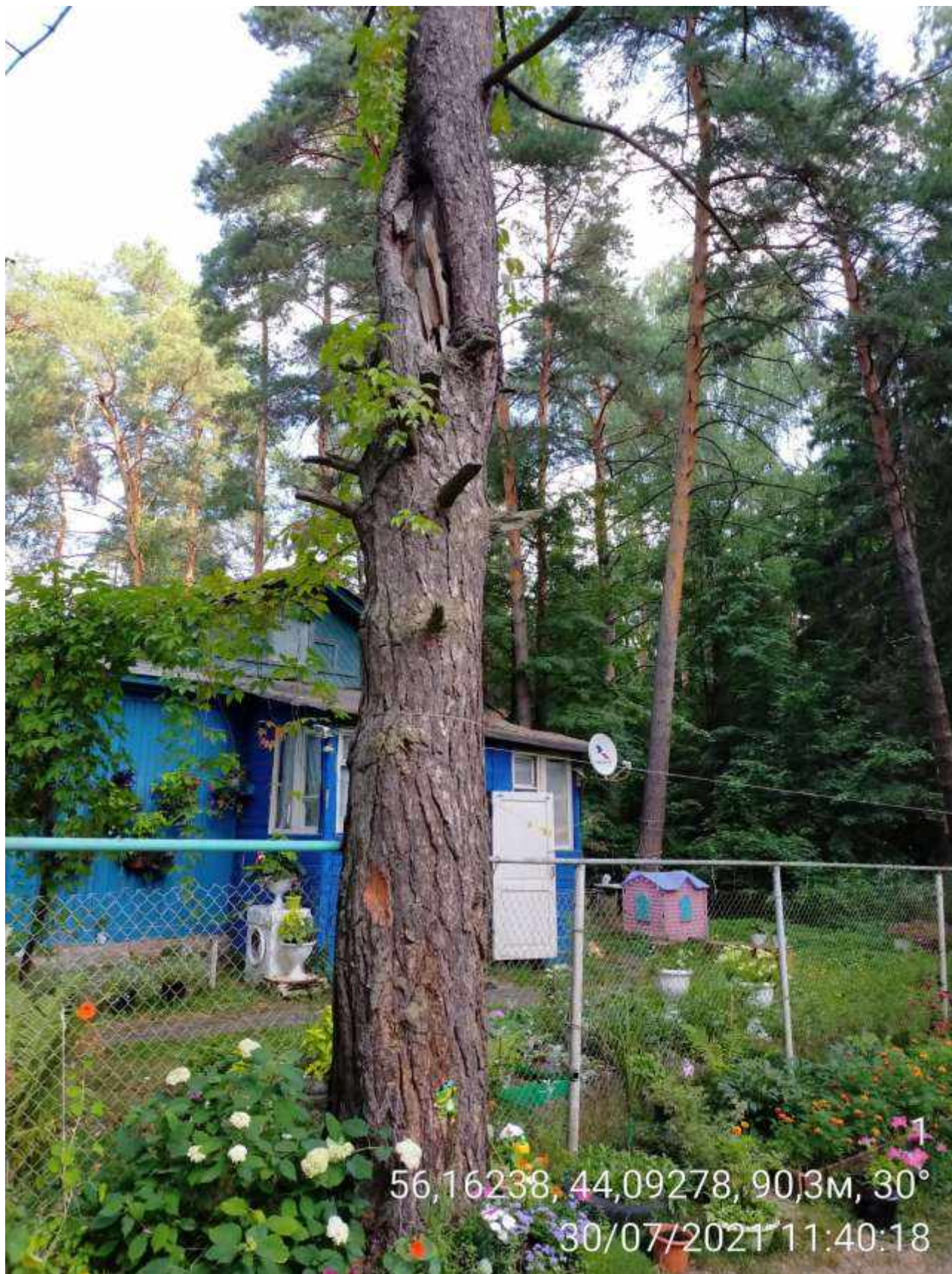
Дерево № 1